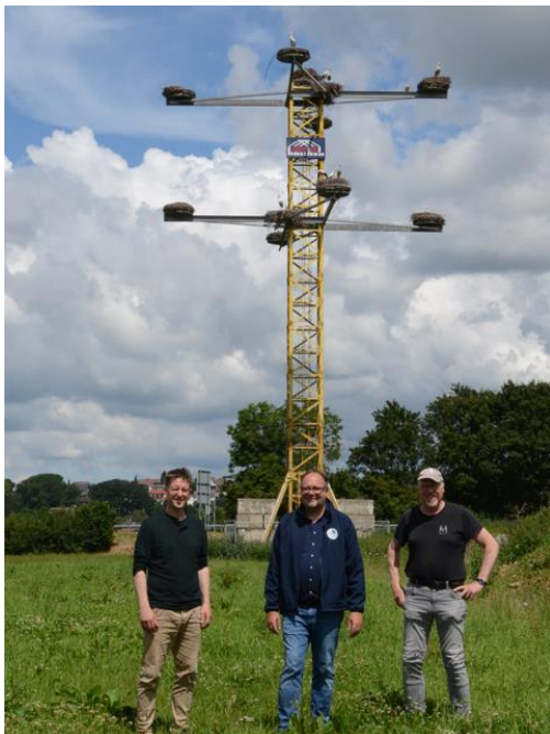
Verdens eneste storketårn i Kirchheim.

Vi fortsætter syd på til Pfaffenhausen og gør holdt her for at se byens storkereder og nyder en "Storchen Bier". Stoppet her bliver på cirka en time.